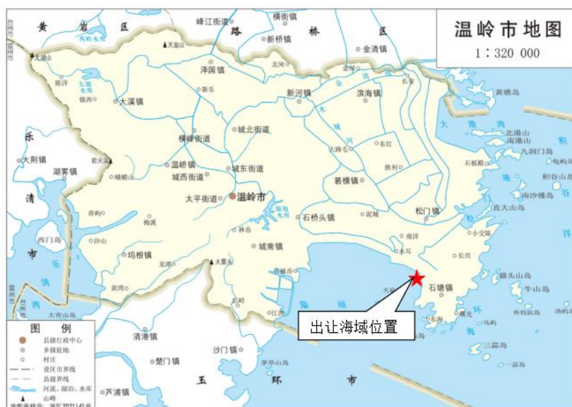
图1出让海域地理位置图

1、出让标的：温岭市苍山门海域的海域使用权，宗海面积为196.1779公顷，距离温岭市区约15km。养殖用海区域东临温岭市上马工业区，西侧为隘顽湾滩涂，北面为陆地海水池塘和农田，南面临海。见图1地理位置图、图2出让海域范围图。