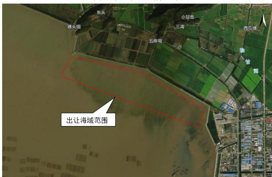
图2出让海域区域范围图